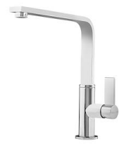
Mitigeur Lorenzo 8466 000