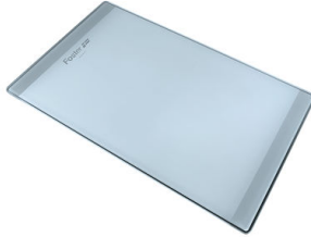
Planche de découpe en verre 8631 300